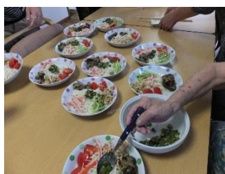
ぶっかけうどん作り