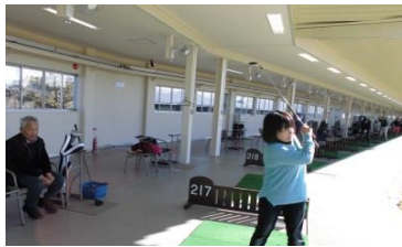
利用者さんの指導で職員が初挑戦！