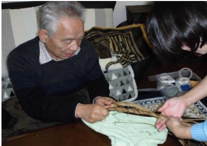
1. 三本の藁を編んで