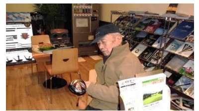
ドライバーを手に取り眺める姿も……

かつて、ゴルフが趣味だった方々と練習場へ行ってみました。腕前は今も変わらず抜群です。ゴルフショップへ入りクラブを眺める方もいました。