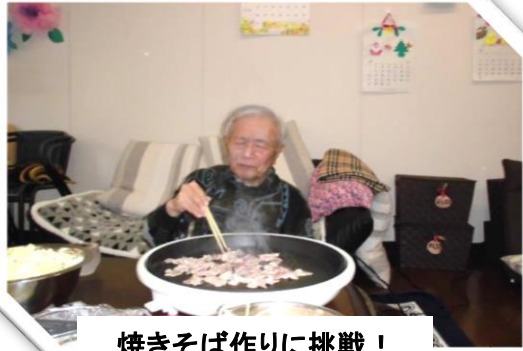
焼きそば作りに挑戦！