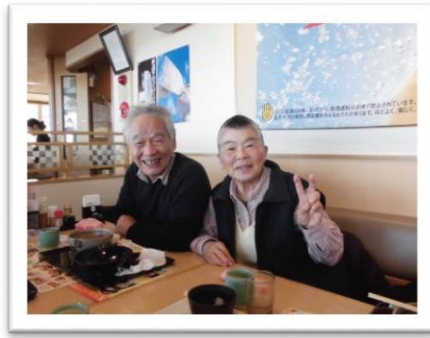
お腹いっぱい！満足、満足♪

一月の食事外出は、とんでんに行きました。メニューが豊富なため、みなさん悩みに悩んでいましたが、各々が食べたいものを選んでました。外で食べる機会がない方はまた皆で来ましょうね！」と喜んでいました。次はどこに行きたいか、またみんなまで考えましようね♪