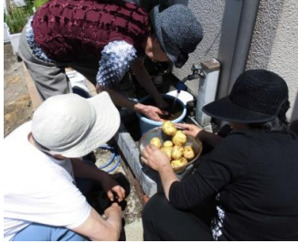
しっかり洗ってコロケを作りました