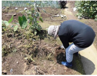
「こうするのよ〜！」と職員に実演中