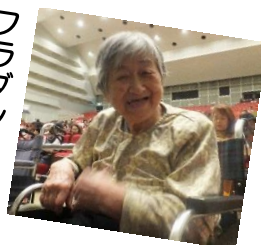
フラダンスを 見に行ったり