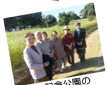
昭和記念公園の コスモスを見たり