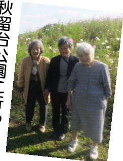
秋留台公園に行ったり