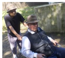
昭和公園で 散歩したり