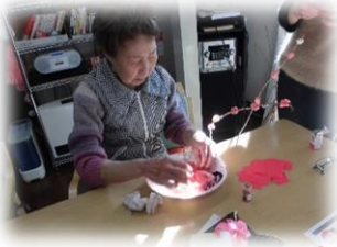
七草粥で 煮病息災