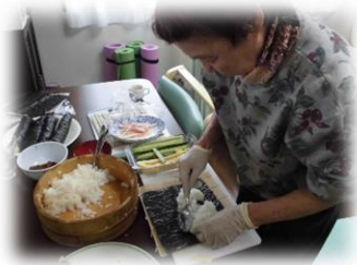
恵方巻き作りにもうどん打ち