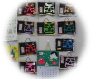
色んな表情の鬼たち